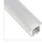
56696 PROFILO INC FONDO CARTONGESSO