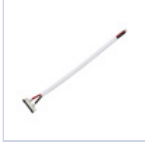
56621 CONN STRIP TO DRIVER 5PZ