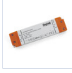
4709 DRIVER ISOLATO 24V IP20 30W