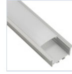
56691 PROFILO CARTONGESSO CON MOLLE