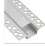
56693 PROFILO CARTONGES RASATO LARGO