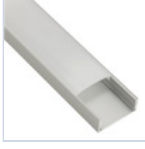
56690 PROFILO PLAFONE LARGO