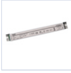
4722 DRIVER PUSH TO DIM 24VIP20 60W