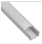
56694 PROFILO 2MT STRIP PLAFONE