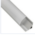
56627 PROFILO 2MT STRIP ANGOLARE