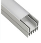
56628 PROFILO 2MT STRIP DISSIPATORE