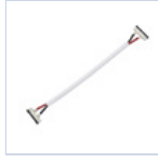
56622 CONN STRIP TO STRIP FILO 4PZ