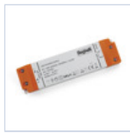
4714 DRIVER ISOLATO 24V IP20 200W