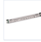
4721 DRIVER PUSH TO DIM 24VIP20 30W