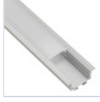
56695 PROFILO 2MT STRIP INCASSO