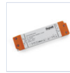
4710 DRIVER ISOLATO 24V IP20 60W