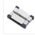
56620 CONN STRIP TO STRIP 10PZ