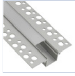
56692 PROFILO CARTONGESSO RASATURA