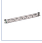
4721 DRIVER PUSH TO DIM 24VIP20 30W