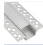
56693 PROFILO CARTONGES RASATO LARGO