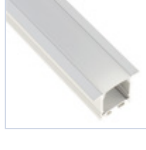
56696 PROFILO INC FONDO CARTONGESSO