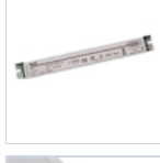
4722 DRIVER PUSH TO DIM 24VIP20 60W