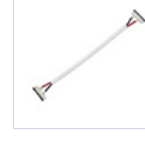
56622 CONN STRIP TO STRIP FILO 4PZ