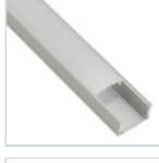
56694 PROFILO 2MT STRIP PLAFONE