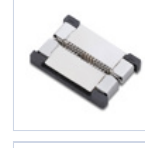
56620 CONN STRIP TO STRIP 10PZ