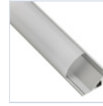
56627 PROFILO 2MT STRIP ANGOLARE