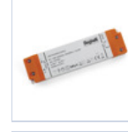
4714 DRIVER ISOLATO 24V IP20 200W