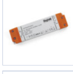
4712 DRIVER ISOLATO 24V IP20 100W