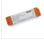
4711 DRIVER ISOLATO 24V IP20 75W