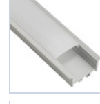
56691 PROFILO CARTONGESSO CON MOLLE