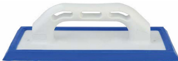
FRPLAINTON-01 Frattone spargibuiacca