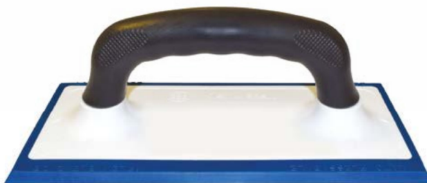
FRPLAINTON-01B Frattone spargibuiacca monoblocco