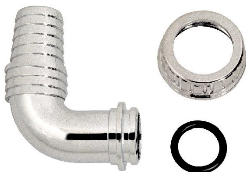
Immagine a puro scopo illustrativo.