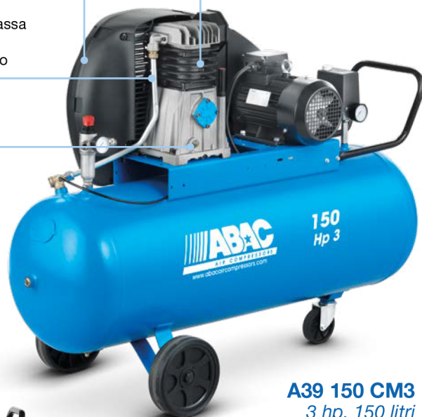
A39 150 CM3 3 hp, 150 litri

Controllo e rifornimento dell'olio agevoli