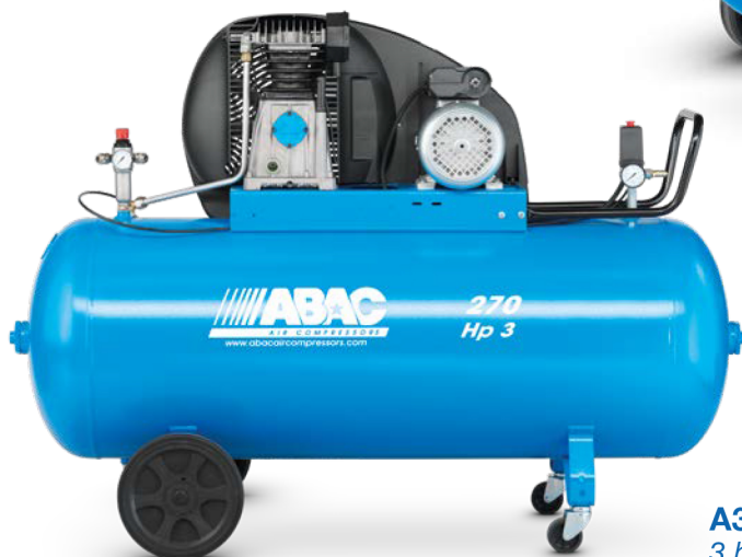
A39B 270 CM3 3 hp, 270 litri