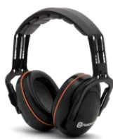
Cuffie protettive Cuffie protettive con fascia