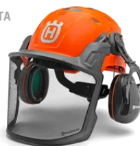
Elmetti per uso forestale Elmetto forestale - Technical