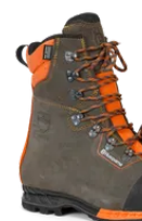
Scarponi in pelle Scarpono antitagli Cl. 2