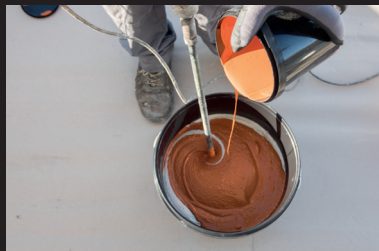
Miscelazione del prodotto