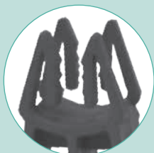
Distanziatore a due forchette