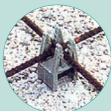
Esempio di utilizzo