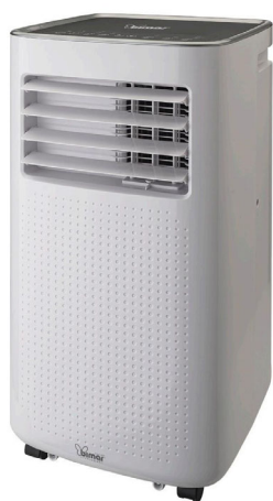
3 Funzioni in un unico apparecchio