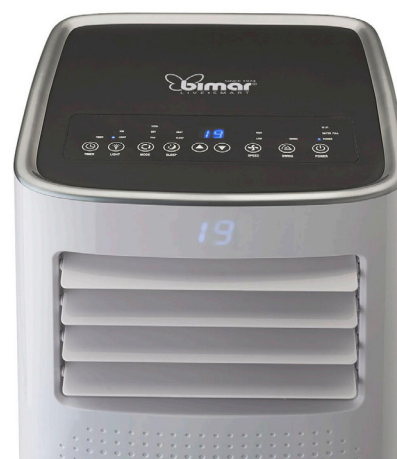
Display frontale retroilluminato