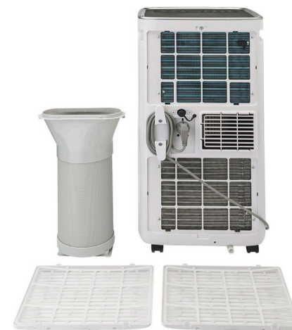
Kit finestra incluso