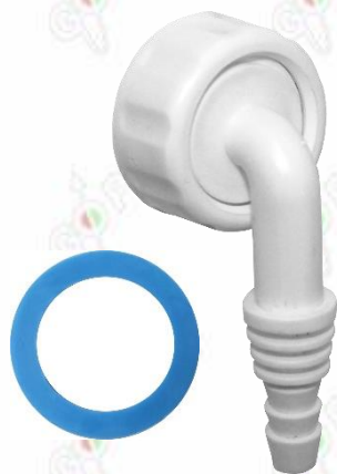
Immagine a puro scopo illustrativo.

Go Plast srl si riserva il diritto di modifica dell'articolo senza preavviso. Ogni riproduzione, anche parziale, è severamente vietata.